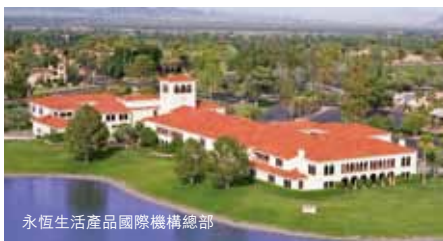
永恆生活產品國際機構總部